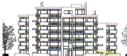
lägenheternas placering i huset